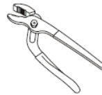
Groove Joint Pliers Pince multiprise Pinzas ajustables